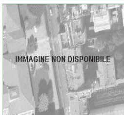
IMMAGINE NON DISPONIBILE

Regione : Lombardia Comune : VIADANA Indirizzo : VIA CARDUCCI 115 Piano : T Interno : Coordinate GIS : 44,9167 10,5167